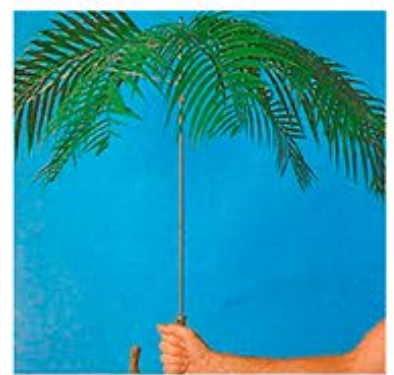
Love Actually | 2003 United Kingdom