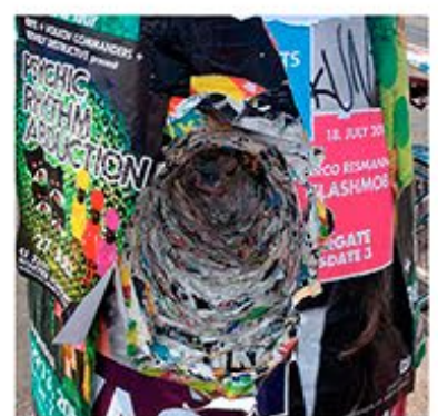
Katka | 2000 Česká Republika